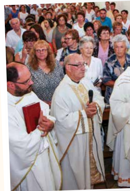
Juricani - GOSPA SNJEŽNA Giurizzani - Madonna della neve 01.-05.08.2015.