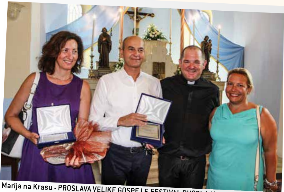
Marija na Krasu - PROSLAVA VELIKE GOSPE I 5.FESTIVAL BUCOLAJA Madonna del Carso - Sagra della Madonna Grande e 5. festival dei bussolai 14.-16.08.2015.