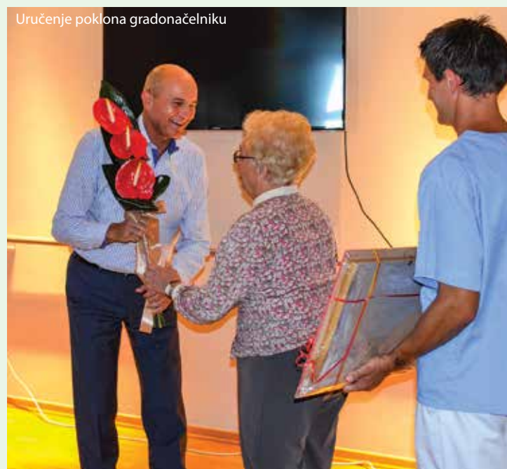
Uručenje poklona gradonačelniku