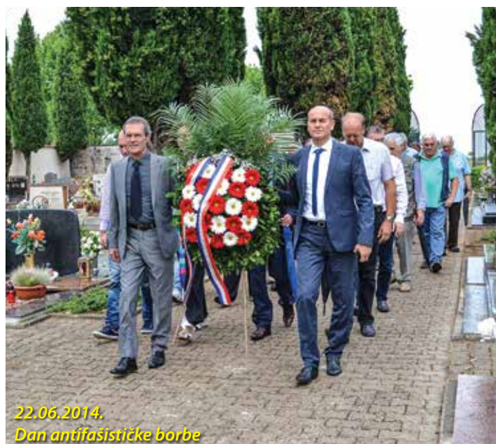
22.06.2014. Dan antifašističke borbe