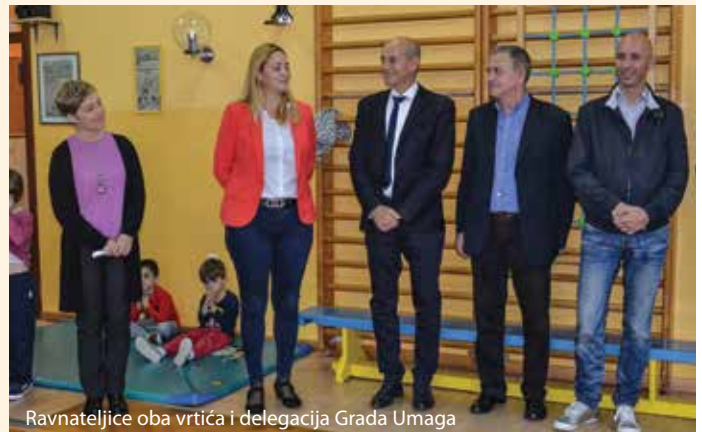
Ravnateljice oba vrtiča i delegacija Grada Umaga