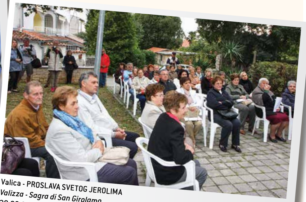
Valica - PROSLAVA SVETOG JEROLIMA Valizza - Sagra di San Girolamo 30.09.2015.