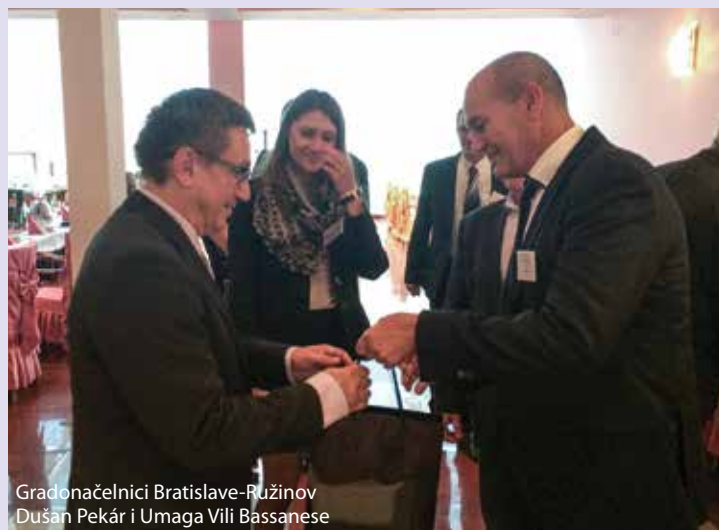
Gradonačelnici Bratislave-Ružinov Dušan Pekár i Umaga Vili Bassanese

Na subotnjoj manifestaciji "Folkfest" delegacije Grada Umaga i Bratislave – Ružinov pratili su i dali podršku našem Folklornom društvu "Umag" koji su svojim plesnim nastupom promovirali kulturnu baštinu i tradiciju našega kraja. Na manifestaciji svoju su tradicionalne plesove i narodne nošnje predstavile i mnoge druge nacije.