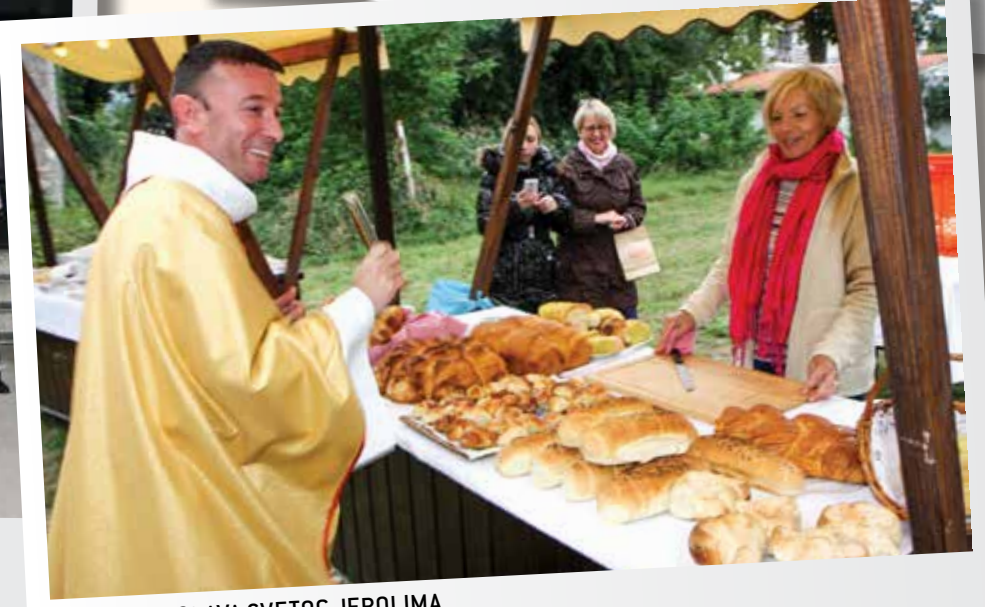
Valica - PROSLAVA SVETOG JEROLIMA Valizza - Sagra di San Girolamo 30.09.2015.