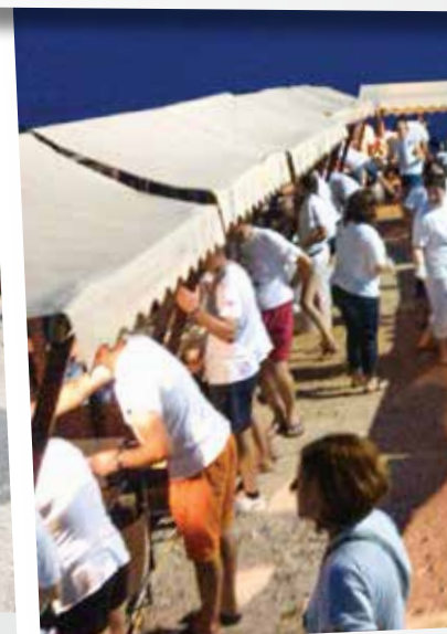
Seget - NOĆ SVETOG PELEGRINA Seghetto - La notte di San Pellegrino 04.07.2015.