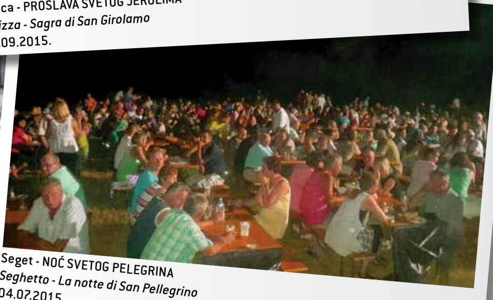
Seget - NOĆ SVETOG PELEGRINA Seghetto - La notte di San Pellegrino 04.07.2015.