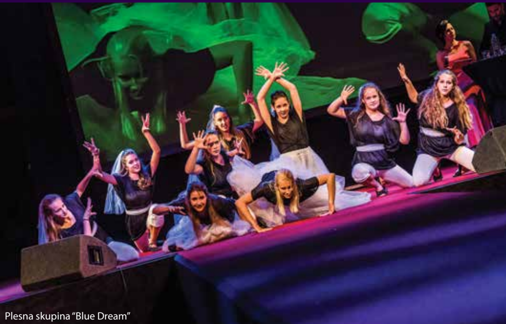
Plesna skupina “Blue Dream”