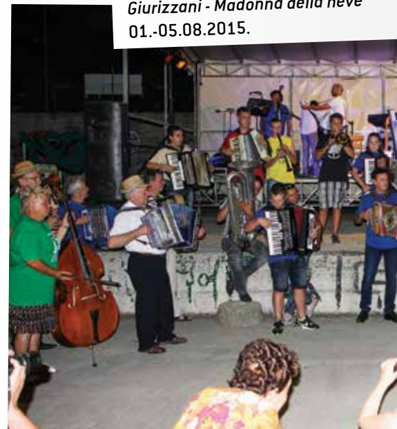
Juricani - GOSPA SNJEŽNA Giurizzani - Madonna della neve 01.-05.08.2015.