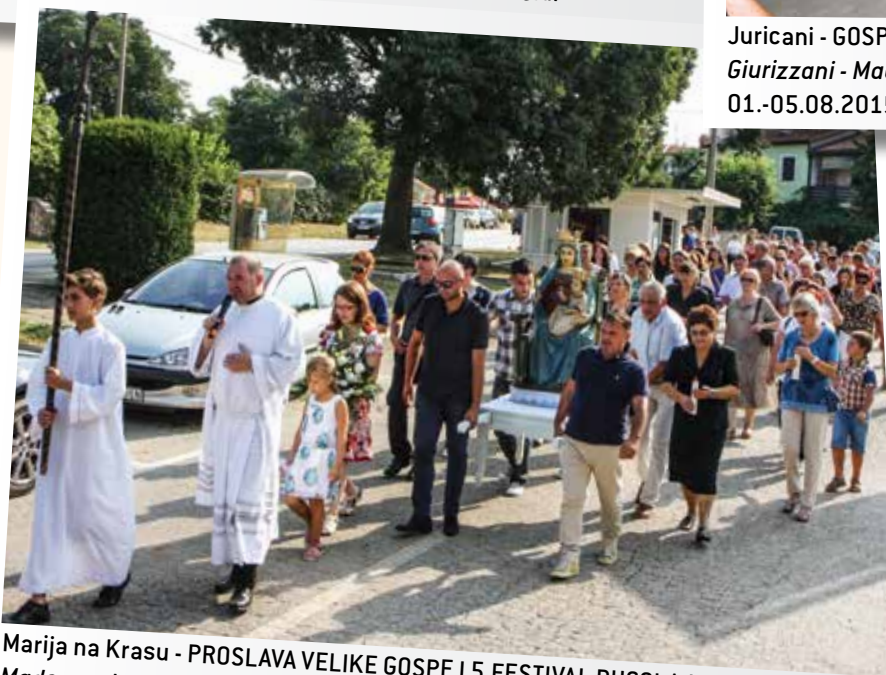
Marija na Krasu - PROSLAVA VELIKE GOSPE I 5.FESTIVAL BUCOLAJA Madonna del Carso - Sagra della Madonna Grande e 5. festival dei bussolai 14.-16.08.2015.