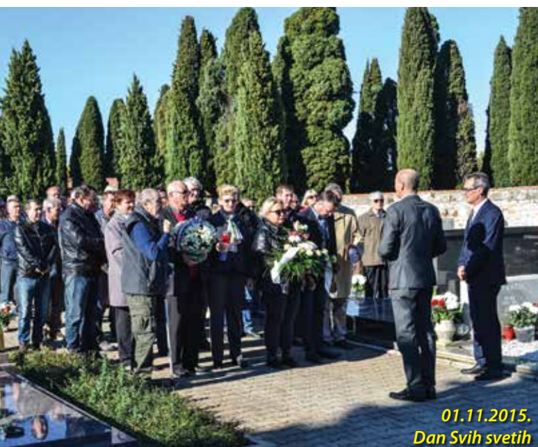
01.11.2015. Dan Svih svetih