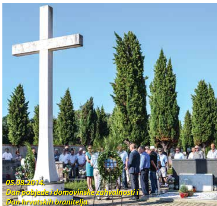
05.08.2014. Dan pobjede i domovinske zahvalnosti i Dan hrvatskih branitelja