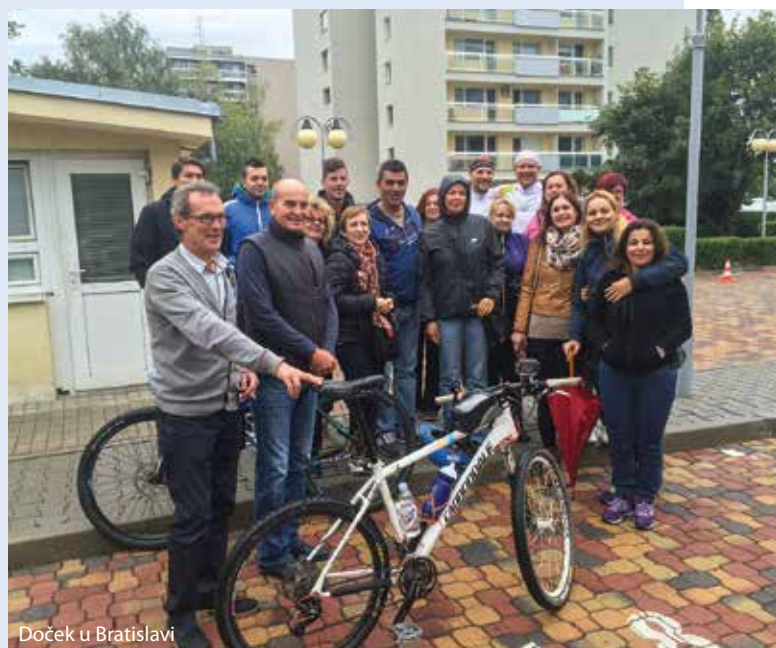
Doček u Bratislavi